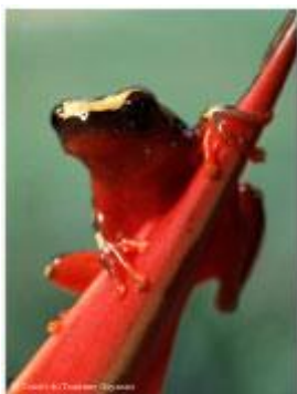
Photos non contractuelles